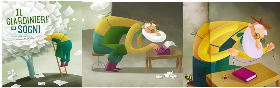
Il giardiniere dei sogni / Claudio Gobbetti, Diana Nikolova. Sassi Editore, 2019 - da 5 anni