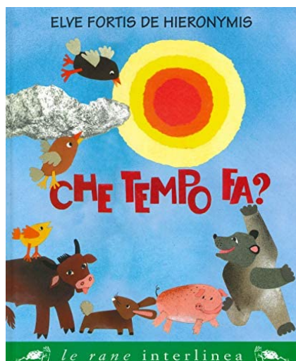
Che tempo fa? / Elve Fortis de Hieronymis. Interlinea, 2019 - da 3 anni