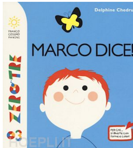
Marco dice! / Delphine Chedru. Franco Cosimo Panini, 2017- da 1 anno