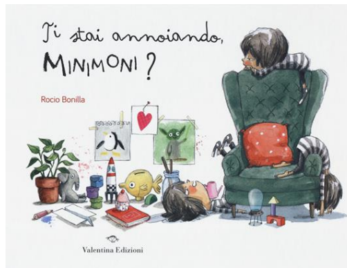
Ti stai annoiando, Minimoni? / Rocio Bonilla. Valentina edizioni, 2019 - da 3 anni

Il vero nome della piccola protagonista del libro è Monica, ma il suo soprannome è Minimoni, come la nota girl group giapponese. L'albo dal formato orizzontale è una sorta di diario dove la bimba, dalla folta chioma a caschetto e i grandi occhi rotondi, si racconta in prima persona, con un testo narrativo semplice e qualche parola significativa in corsivo, illustrato con disegni dai colori tenui e sfumati.