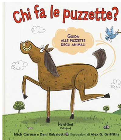
Chi fa le puzzette? : Guida alle puzzette degli animali / Nick Caruso e Dani Rabaiotti ; illustrazioni di Alex G. Griffiths. Nord-Sud, 2019 - da 6 anni

Ci siamo mai chiesti se anche gli animali fanno le puzzette? Questo libro esilarante ha lo scopo di rispondere a questa domanda offrendoci una guida con argomenti scientifici esposti con tono leggero. La premessa espone la fisiologia dell'apparato intestinale degli animali in cui avviene il processo di digestione e assimilazione del cibo ingerito e spiega come l'ingestione di aria nel corso del pasto, associata con la produzione di gas favorita dalla presenza di una gran massa di batteri presenti nell'intestino, determina la necessità di espulsione di questi gas con le puzzette più o meno frequenti e più o meno puzzolenti. Così scopriamo quali animali fanno le puzzette più puzzolenti, chi ne fa di più e da dove viene tutta questa roba puzzolente, incontriamo perfino una specie che ha un codice segreto speciale basato sulle puzzette! La spiegazione dell'origine delle puzzette è la chiave per indovinare se l'animale le fa o non le può fare perché sprovvisto di microbiota ovvero di flora batterica intestinale. In conclusione divertendosi i bambini imparano che le puzzette le fanno proprio tutti, bambini e bambine, mamme e papà, perché durante la digestione il nostro corpo produce dei gas di scarico che devono pur trovare una via d'uscita, ma gli umani sono gli unici esseri viventi a vergognarsene.