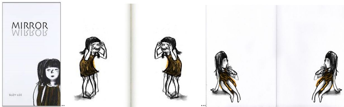
Mirror / Suzy Lee - da 5 anni

Anche questo originale silent book della brillante illustratrice coreana, il primo della Trilogia del limite assieme a L'onda e L'ombra , esalta il gioco e il potere dell'immaginazione riuscendo ad utilizzare in modo geniale le potenzialità dell'oggetto-libro. Qui la rilegatura centrale, il punto di incontro della doppia pagina, diventa il fulcro principale attorno al quale ruota l'intera storia.