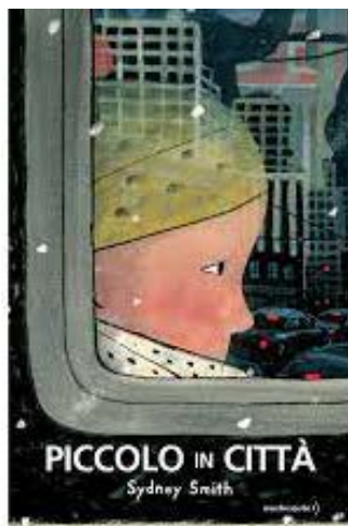
Piccolo in città / Sidney Smith. Orecchio acerbo, 2020 - da 4 anni

Il “piccolo” campeggia in primo piano in copertina: dal finestrino di un autobus con sguardo fisso e assorto osserva la città che si avvicina. Per il nostro protagonista, un pensieroso bambino solo e imbacuccato nella sua sciarpa e nel suo cappello di lana, inizia così un viaggio che si rivelerà pieno di intense emozioni. Arrivato alla meta scende dall’autobus, si avvia sul marciapiede inoltrandosi nel centro della grande città che fa paura; lui è piccolo in mezzo a tanti grandi che camminano frettolosi senza neanche accorgersi di lui. Una voce fuori campo, con parole dolci e tranquillizzanti, dà vita ad un monologo interiore che accompagna il suo percorso attraverso le insidie che la grande città nasconde. Sono parole di comprensione, empatia ed incoraggiamento che consigliano e svelano qualche segreto per affrontare al meglio gli ostacoli. A chi si rivolge la voce fuori campo? Capiamo, un po’ alla volta, che l’interlocutore non è il nostro protagonista ma un suo amico, amato, cercato. Sono gli indizi suggeriti dal testo e dalle immagini a consentire che si formi in noi l’immagine dell’amico perduto fino a quando un cartello con la foto di un gattino con la scritta “Perso” ce ne dà piena conferma. È allora che il viaggio si palesa come una ricerca toccante: anche se è “piccolo” il bambino sa di poter aiutare qualcun altro