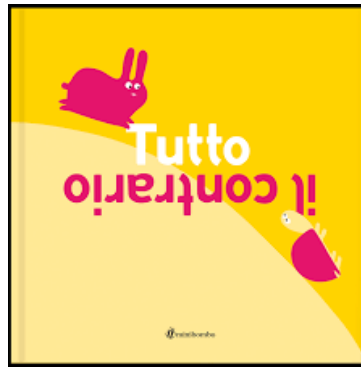
Tutto il contrario / Silvia Borando. Minibombo, 2020 - da 2 anni

Che questo non sia il solito albo illustrato sui contrari, lo si intuisce già dal titolo che presenta al lettore in una posizione capovolta, proprio la parola “contrario”. Anche in copertina, se letta per intero, aperta e distesa, vengono proposti due scenari contrapposti che introducono alla narrazione. Un coniglio ed una tartaruga si cimentano in una gara di velocità: potrebbero sembrare l’uno il contrario dell’altro da questo punto di vista. Invece, in men che non si dica, vediamo ribaltarsi la situazione. Il coniglio balza velocemente sulla salita, è vero, ma la tartaruga lascia di sasso il coniglio e noi quando, grazie al suo carapace, rotola rapidamente sulla discesa.