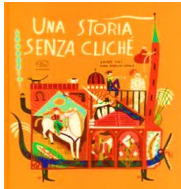
Una storia senza cliché / Davide Cali, Anna Aparicio Català. Edizioni Clichy, 2021 - da 5 anni

Con smaglianti e spiritose illustrazioni, e un dialogo serrato tra due personaggi invisibili, si sviluppa una storia che si dichiara, in copertina, senza stereotipi e pregiudizi di nessun genere, evidentemente ancora assai diffusi nella nostra società e nel mondo della cultura. Appena il misterioso lettore comincia a raccontare, utilizzando personaggi e situazioni della narrazione tradizionale, l'ascoltatore invisibile lo censura drasticamente con incalzanti obiezioni, che non consentono repliche.