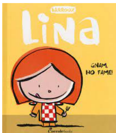
Lina Gnam ho fame! / Barroux. Coccole Books 2019 - da 2 anni