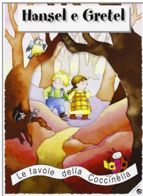
Hansel e Gretel / testo di Giovanna Mantegazza; illustrazioni di Cristina Mesturini. La Coccinella, 2017 - da 3 anni

La Coccinella ha pubblicato una collana di fiabe classiche riscritte in rima da leggere in pochi minuti come recitando una cantilena, in un adattamento per bambini. Questo “Hansel e Gretel” rispetta i contenuti fondamentali della fiaba, con illustrazioni a piena pagina che mostrano tutto quello che il testo racconta, permettendo ai bambini di seguirla senza distrarsi, affascinati dalla cadenza musicale delle rime in un linguaggio semplice ma immediatamente suggestivo. La fiaba è breve come breve è la capacità di attenzione dei più piccoli, ma grazie alla facilità del racconto e alla rapidità del colpo di scena finale con la punizione della strega cattiva, i bambini chiederanno di ascoltarla più e più volte, fino ad impararla quasi a memoria e a cercare magari di raccontarla con parole proprie, arricchendo così la loro capacità di espressione.