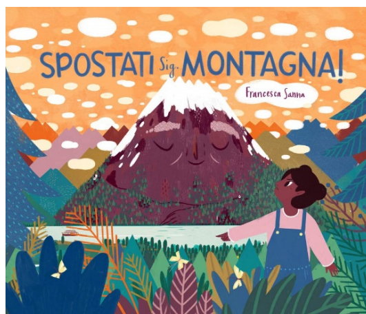
Spostati Sig. Montagna! / Francesca Sanna. Settenove, 2021 - da 5 anni

La storia nasce dalla fantasia della protagonista, Lily che, in seconda di copertina, vediamo seduta alla sua scrivania mentre guarda, attraverso i vetri della finestra, le rocce violacee dell'imponente montagna che occupa tutta la visuale. L'arredo della sua cameretta è assai significativo, con un binocolo, un mappamondo, il modellino di un veliero, un trenino, una mappa geografica: tutti particolari che rivelano la sua innata curiosità e il suo impaziente desiderio di conoscere il mondo. Inizia quindi una trattativa tra la "minuscola umana" e l'enorme Signor Montagna, descritto prima dormiente e poi sempre più animato, nel contesto naturale di un paesino alpino, illustrato con una fila di minute casette bianche affacciate su un lago, contornato da piante, da animali e da umani non sempre rispettosi dell'ambiente.