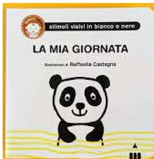
La mia giornata / illustrazioni di Raffaella Castagna. Lapis, 2020 - da 1 anno

Questo libro robusto racconta lo scorrere della giornata di un bambino dal risveglio alla notte propiziata da un libro, attraverso i vestiti, il gioco, la pappa, con disegni a contorni netti che offrono stimoli in bianco e nero, con l'aggiunta di un colore primario come il giallo, immediatamente comprensibili per sviluppare le capacità visive e associative dei più piccoli. Le figure ben contrastate richiamano azioni riconoscibili che il bambino può scoprire facendo scorrere il cartoncino con le figure collegate per senso e imparare a nominarle associandole tra loro: il sole per dire buongiorno, il biberon per bere il latte, la palla per il gioco, il piatto per la pappa e quando arriva la luna... il pigiaminino per la buonanotte. L'esortazione è quindi: fai scorrere la carta e scopri quanti oggetti ti circondano durante la giornata! Il meccanismo di scorrimento delle pagine permette anche alle manine più piccole e inesperte di divertirsi a togliere la card dalla cornice per scoprire l'immagine sottostante, trasformando il libro in un oggetto da esplorare!