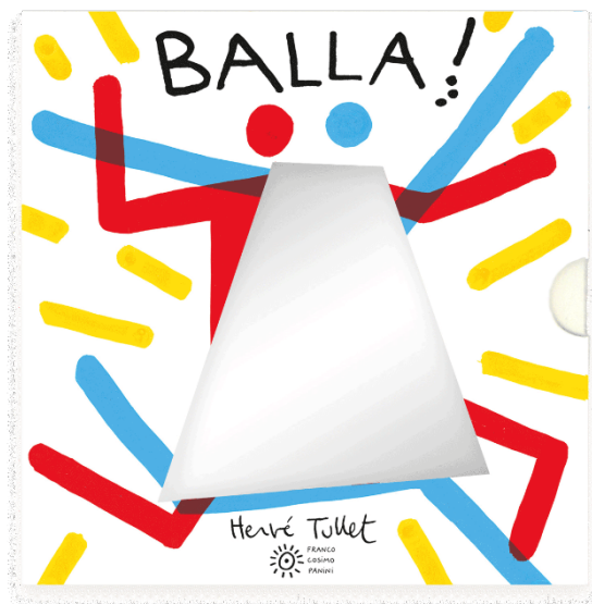
Balla! / Hervé Tullet. Franco Cosimo Panini, 2021 - da 2 anni

Un coloratissimo cartonato dagli angoli smussati, racchiuso in un cofanetto; solo figure stilizzate e variopinte, appena abbozzate, realizzate esclusivamente con poche linee, punti e tratti che spiccano sullo sfondo bianco. Le illustrazioni, in totale assenza di testo, incoraggiano i piccoli lettori, in totale libertà, al ballo e al movimento come suggerisce il titolo.