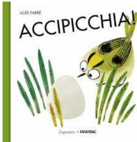
Accipicchia! / Lluís Farré. Fatatrac, 2020 - da 3 anni