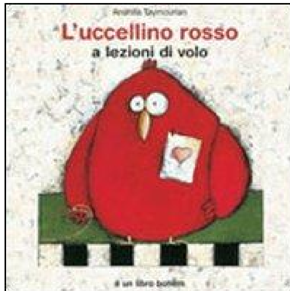
L'uccellino rosso a lezioni di volo / di Anahita Taymourian. Bohem Press, 2008 - da 3 anni

Tutto è tranquillo nello zoo ancora vuoto in un bel mattino di primavera e tutto a un tratto un uovo si apre e dal guscio fa capolino un piccolo essere rosso, un uccellino, e tutti gli animali rimangono stupiti: non ci sono mai stati uccelli nello zoo e meno che meno uno con le piume rosse. Solo e indifeso, l'uccellino rosso diventa subito il beniamino di tutti ma presto gli animali si chiedono come si alleva un uccellino ma soprattutto come si farà ad insegnargli a volare? Quanto al cibo sembra facile, l'uccellino mangia con gusto tutto ciò che gli portano e così cresce rapidamente e impara anche a imitare i suoi benefattori. Bela come le pecore correndo con loro, ma di volare non se ne parla. Una mucca lo spinge a salire su una scala per spiccare il volo, ma l'esito è un disastroso ruzzolone e l'autunno s'avvicina, tutti gli animali trovano un rifugio nelle tane e l'uccellino resta solo al freddo. Ma all'improvviso si avvicina saltellando un batuffolo rosso, un'uccellina che gli danza intorno svolazzando e lui emozionato la imita e pian piano comincia a librarsi in aria: ha imparato a volare! E insieme salutano gli amici e si dirigono verso il caldo sole.