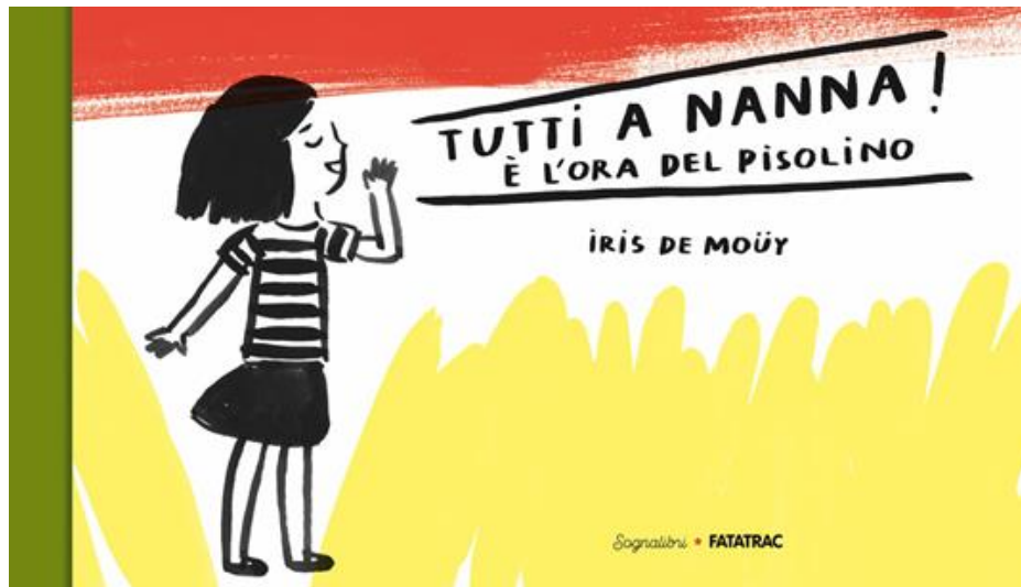
Tutti a nanna! È l'ora del pisolino/Iris de Mouy Fatatrac, 2020 - da 2 anni

Dalla copertina una bambina dalla chioma nera “urla” la frase che ci porta subito nel racconto dove il titolo, ben evidente, è già testo: Tutti a nanna! È l'ora del pisolino . In modo deciso cerca di convincere al sonno quella che si rivela, pagina dopo pagina, una vasta platea di animali della Savana, tredici per l'esattezza. In modo deciso l'invito a fare un pisolino è rivolto a tutti ma, nessuno escluso, proprio non ne vogliono sapere. Ogni animale, seguendo il proprio carattere, reagirà opponendo una valida scusa.