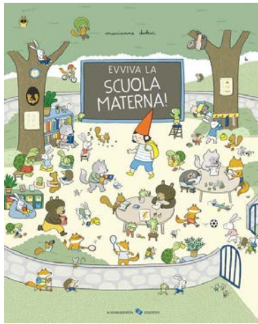
Evviva la scuola materna! / Marianne Dubuc. La margherita, 2021 - da 3 anni