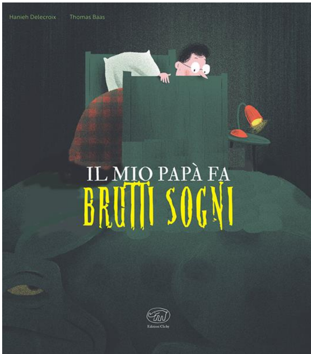
Il mio papà fa brutti sogni / Hanieh Delecroix, illustrazioni di Thomas Baas; traduzione di Maria Pia Secciani. Clichy, 2021 - da 4 anni

Un comodino con una lampada spenta, un libro chiuso e poi un urlo nella notte! Un bimbo accorre e trova il papà con gli occhi sbarrati, non riesce a dormire ha avuto di nuovo un incubo! Sogna mostri che gli portano via l'automobile, le cartelle di lavoro, gli strappano la camicia e ha una grande paura e allora il figlio cerca di rassicurarlo in tutti i modi, i mostri non esistono! Sono solo ombre dei sogni gli dice, non deve avere paura, lo coccola per farlo addormentare perché deve assolutamente cercare di dormire, domani c'è scuola e il nostro piccolo protagonista deve riposare per riuscire a svegliarsi e non fare brutte figure!