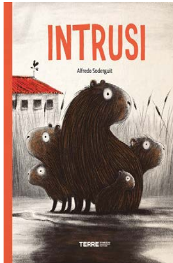
Intrusi / Alfredo Soderguit; traduzione di Sara Ragusa. Terre di Mezzo, 2021 - da 3 anni

Già la copertina è alquanto inquietante.