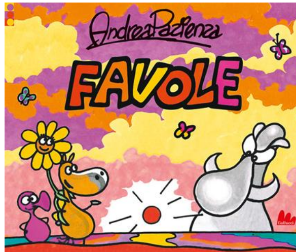
Favole /Andrea Pazienza. Gallucci 2013 - da 5 anni

In un tripudio di colori stesi a tutta pagina, si articola questo prezioso, primo e unico, libro di favole di quel genio che fu Andrea Pazienza, scritto nell'estate del 1986, in occasione della nascita del figlio di uno dei suoi tanti amici.